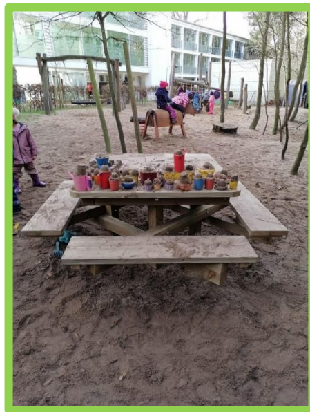
Wir haben neues Sandspielzeug bekommen